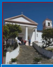
S. BARBARA BUGGERRU